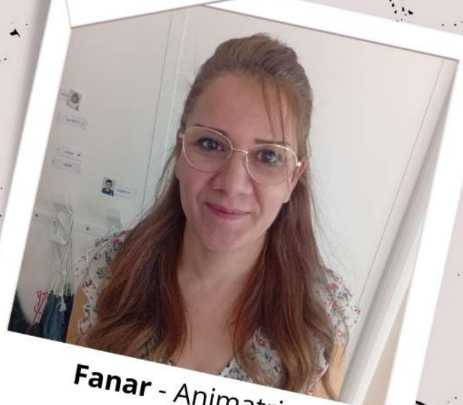
Fanar - Animatrice Midis