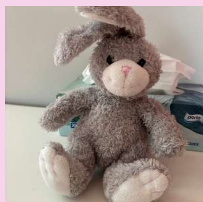
TITI NOTRE MASCOTTE